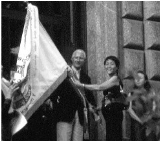
PASSAGGIO DI CONSEGNE Agosto 2002 Il Sindaco di Monza riceve il gonfalone della manifestazione dal Console Giapponese.

Spagna, Irlanda, Repubblica Ceca, Russia, Taiwan, Norvegia, Sud Africa, Olanda, Italia. La cerimonia di apertura, sabato 5 luglio, darà il via al campionato, la Regina Teodolinda con il suo seguito di cortigiani, musicisti e sbandieratori darà il benvenuto ai 2000 ragazzi delle bande che