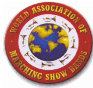
Lo stemma della WAMSB

Delegato italiano presso la WAMSB e responsabile per l'Europa orientale,